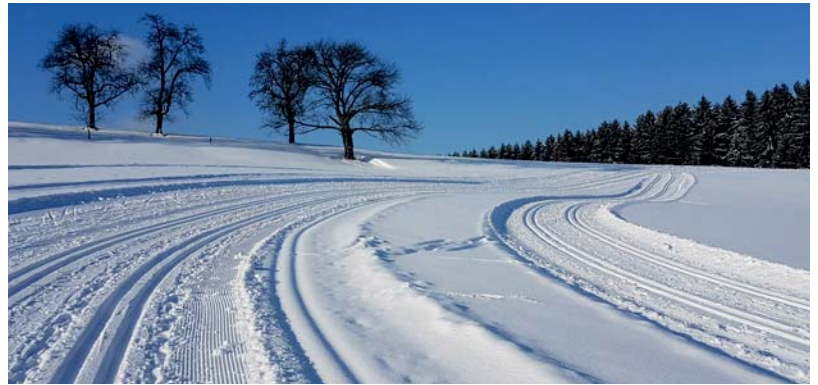
Drei klassische Loipen und eine Skating-Spur garantieren Langlaufvergnügen pur!