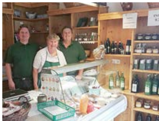
Bekannt für die große Auswahl – www.hofladen-kicker.at

Auf dem konventionell bewirtschafteten Betrieb werden Mais, Getreide, Erdäpfel, Zwiebeln sowie Ölkürbisse in Wechselfrucht angebaut. Alles wird an die Schweine, Ziegen, Hasen und Hühner verfüttert. Stallungen und Schlachträume befinden sich am Hof, dadurch gibt es keine langen Transportwege, auf denen die Tiere unnötigem Stress ausgesetzt sind. Sämtliche Produkte werden hausintern aufgearbeitet und weiter zu Selchwaren oder Würsten verarbeitet. Auch für Brot, Kernöl, Eier, Schnäpse, Most, Apfelsaft, Pfirsichnektar, Knabberkerne, Honig und kleinere Bastelarbeiten ist genug Platz in den Regalen des Hofladens vorhanden.