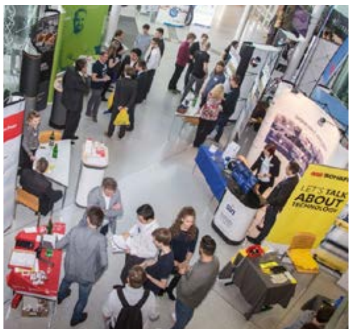
Am alljährlichen Recruiting Day tauschen sich Schüler und Wirtschaft aus.