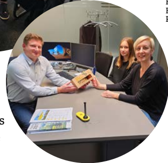
Viele nahmen die Gelegenheit wahr, sich bei den Oktobergesprächen ausführlich persönlich beraten zu lassen.